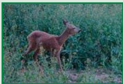
So sieht der Mensch ein Schmalreh in der Dämmerung ...