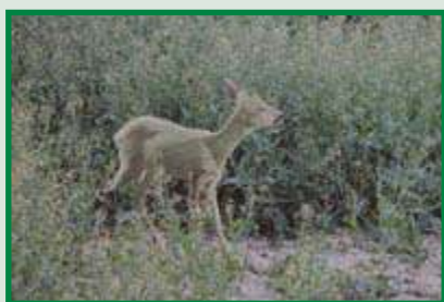
... und so sieht ein anderes Reh das Stück im Raps.

UV-Strahlung spielt aber auch bei dämmerungsaktiven Arten eine Rolle. Hirsche zum Beispiel sind nachgewiesenermaßen in der Lage, kurzwellige Strahlung bis hin zum UV-Licht wahrzunehmen. Die Tiere finden sich in der Dämmerung deshalb so gut zurecht, weil der Anteil kurzwelliger Strahlung im Dämmerlicht deutlich höher ist als am Tag.