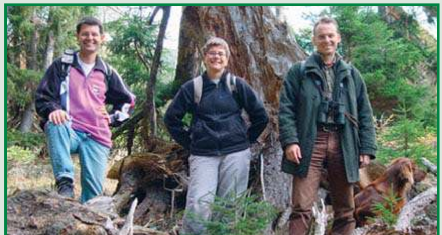
Der Autor (rechts) mit Wanderern in der typischen bunten Bekleidung wie der Mensch sie sieht.

Für die Säuger unter den Wildtieren stechen also vor allem Blautöne heraus, die wie Signalfarben wirken.